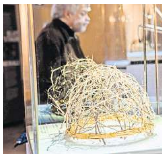
Die Replik einer Dornenkrone ist in einer Vitrine ausgestellt.

Er wurde zunächst gegeißelt und dann gekreuzigt. Die Blutspuren auf dem Grabtuch beweisen das“, ist Lukas überzeugt.