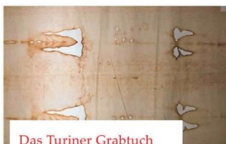
Das Turiner Grabtuch

In der Grabtuchkapelle des Turiner Doms wird ein 4,36 Meter langes und 1,10 Meter breites Leinentuch aufbewahrt, das ein Ganzkörperbildnis der Vorder- und Rückseite eines Mannes zeigt. Nach der Überlieferung handelt es sich um das Grabtuch Christi, soll also den gekreuzigten Jesus von Nazareth zeigen.