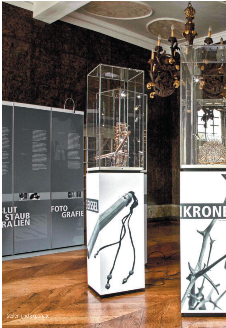
Stelen und Exponate